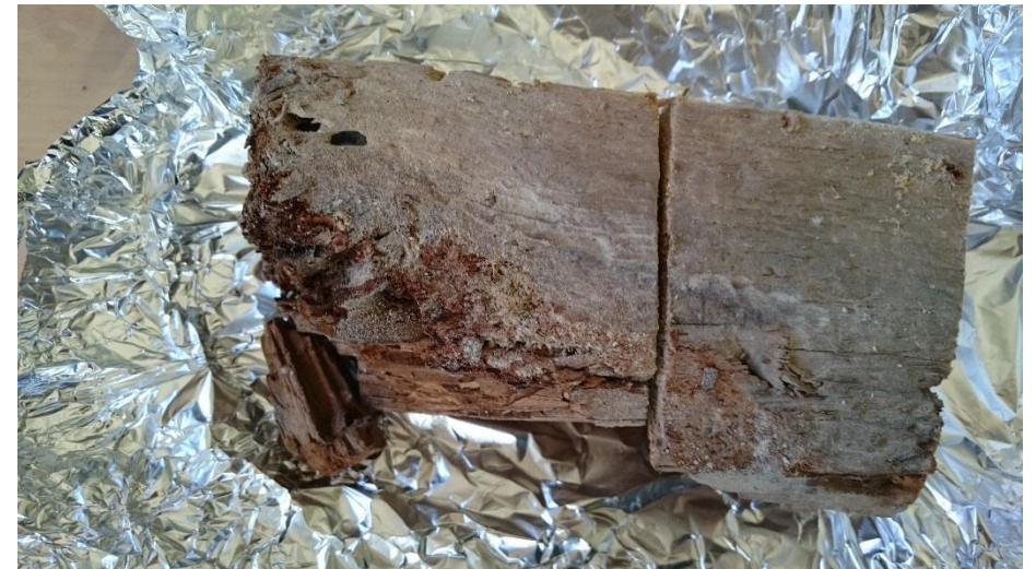
Bit av bjälklag impregnerat med klorfenol